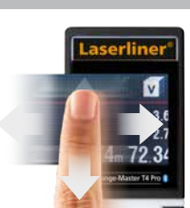
Pantalla táctil para cambiar las funciones