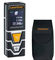
LaserRange-Master T4 Pro

* Véase precisiones específicas por sectores en el manual de instrucciones.