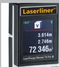
Pantalla LC en color con iluminación